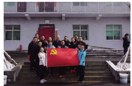
图为跑团人员合影

2月10日上午,冒着凛冽的寒风,晋城市绿丝带志愿者协会、晋城合聚心脑血管病医院及其他志愿者单位,一行30余人满载着新年的祝福和慰问品来到了位于陵川县西河底镇的一个贫困小山村——西河底村进行了慰问,并表达了对他们的新年祝福。