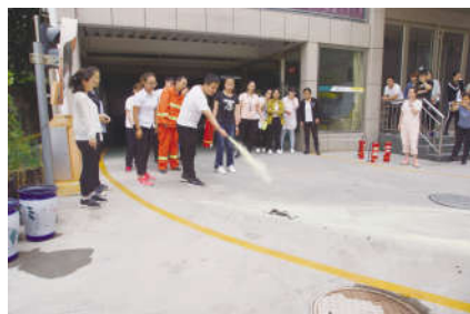
图为集团机关消防演练现场