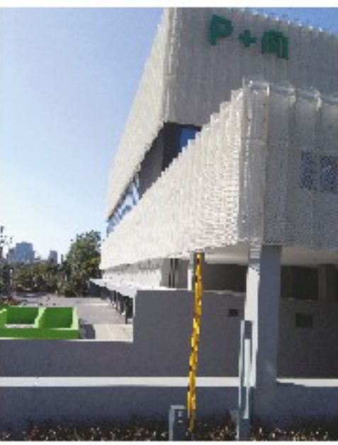
苏州市首家 P + R 停车楼亮相高新区竹园路。位于竹园路北,新升新苑南门东,是一座现代化立体智慧停车大楼。停车楼停车方式是“激光导航+梳齿交换”形式停车。通过搬运器和座位上互相交叉的梳齿机构实现车辆的位置交换,更安全、快捷,全流程取车时间