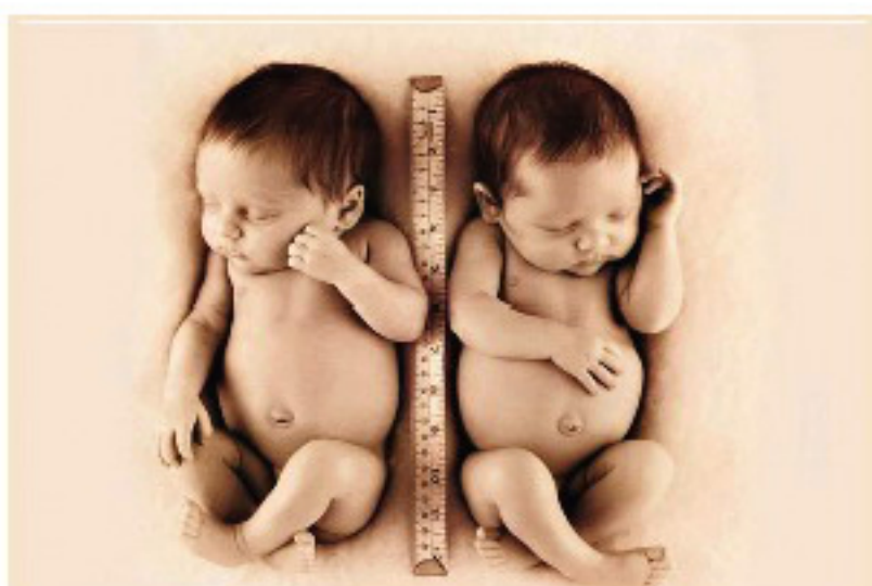
每5000个出生的婴儿中有一个是没有肛门的,由医院手术创理。