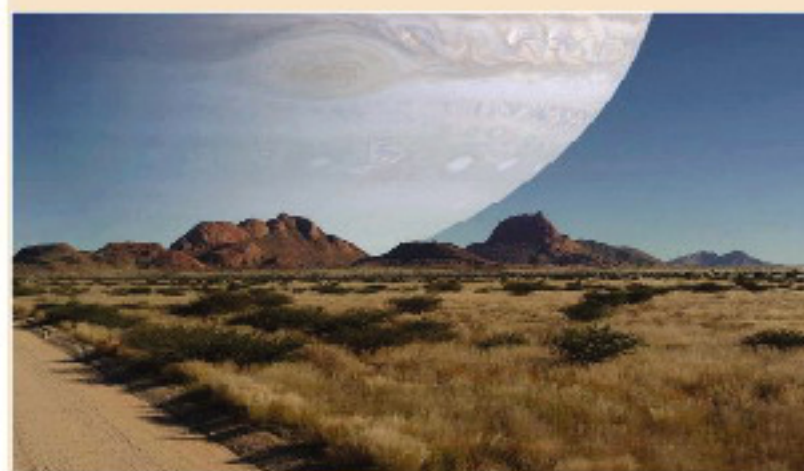
如果木星和月亮一样接近地球的话,这将是您看到的木星的样子。