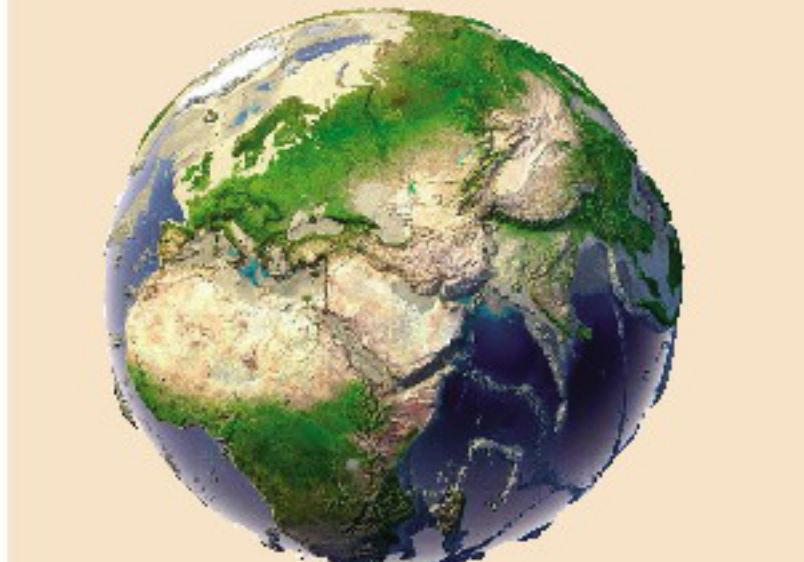
如果你在地球的中心挖一个洞,把一本书丢下去,42分钟后到达底部。