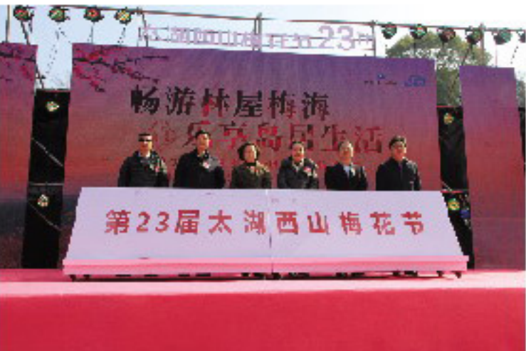
第23届太湖西山梅花节

梅开百花之先,独天下而春。在中国传统文化中,梅花早已不仅仅是一种花卉,它已成为广阔、丰富、深邃的人文精神,是在几千年食用、培育、观赏、研究中不断追求和凝练的中华民族之魂。它让中国人的精神世界更加瑰丽,让中华文明更加厚重与璀璨。