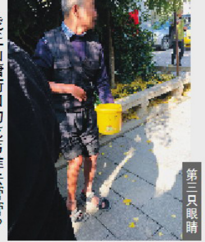
虎丘山塘街口的乞丐谁去管管? 第三只眼睛

位老人首选食品;有13位老人最为看重的是商品的价格和品质,网上时不时的优惠对他们尤其具吸引力,有2位老人看重提货方便。 调查数据显示,品种多、价格优惠确实是老人网购的一大动力,网络购物也成为老人之间交流与分享的话题,为他们的晚年生活增加了不少乐趣。调查也发现,相较于年轻人的网购习惯,老年人在网购的时候会更加理性,他们不会“上瘾”,不会只因“便宜”就下单购买,而是看是否真需要。对于金额较大的商品或大件商品,他们还是依赖于实体店,或在多渠道对比后再购买。(陈明 一得)