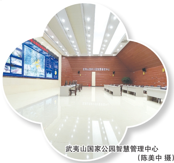
武夷山国家公园智慧管理中心

位于福建省西北部的武夷山,拥有独特罕见的丹霞奇峰、九曲溪韵,以及千年茶文化、朱子理学等深厚历史文化底蕴,于1999年被联合国教科文组织列为世界文化与自然遗产。面对世遗地生态保护与人文传承的复杂挑战,近年来,武夷山国家公园福建片区大胆创新,打造全方位的智慧守护系统,为世遗穿上高科技“保护罩”!