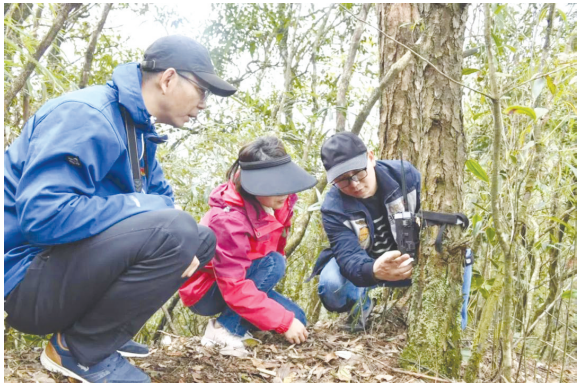
科研人员在武夷山国家公园布设红外线相机

你知道武夷山中还有多少“隐藏居民”吗?武夷山国家公园福建片区的生物资源本底调查,正在为这些神秘的生灵建立专属的“自然档案”!