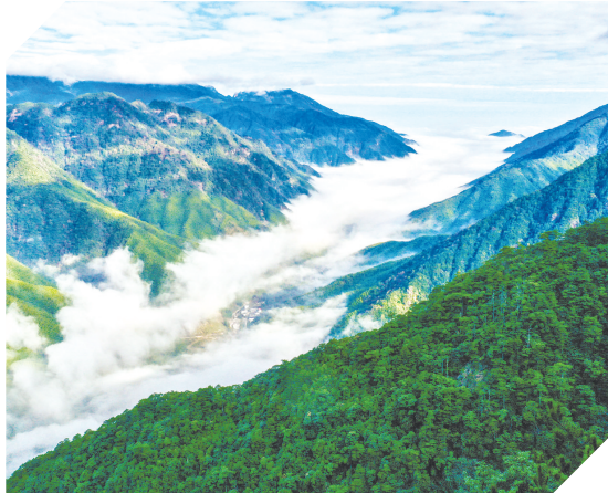
武夷山国家公园森林云海

文化守护方面,福建省构建了文化遗产保护体系,出台《福建省武夷山世界文化和自然遗产条例》;将文化遗产保护等纳入《福建省武夷山国家公园条例》;编制《武夷山世界文化和自然遗产保护管理规划》《武夷山国家公园总体规划(2023-2030年)》,制定资源保护等11项管理制度和生态保护修复等12个规范标准……这些举措不仅守护了武夷山的历史根脉,也为世界文化与自然遗产的保护贡献了“中国智慧”。