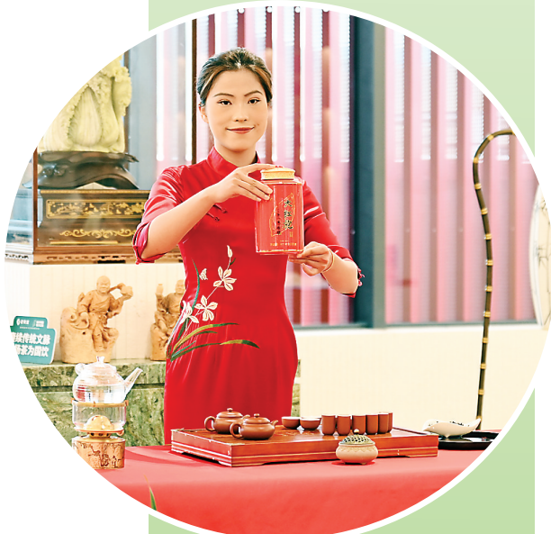
6月25日,武夷星茶业有限公司工作人员为游客展示茶艺。