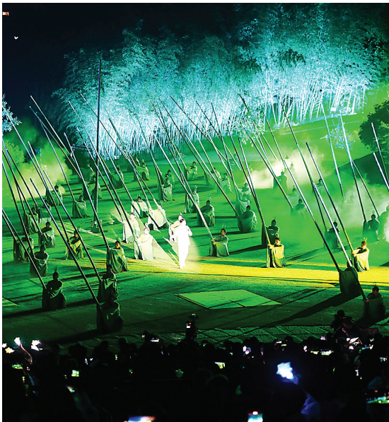
以世界自然和文化双遗产地武夷山为地域背景,将自然景观、茶文化及民俗融于一体的《印象大红袍》表演(4月21日摄)。

今年以来,武夷山推出了武夷山国家公园探秘之旅、采茶制茶体验之旅、朱子文化研学之旅三大主题产品,依托国家公园1号风景道自驾游、崇阳溪漫道骑行游、星村滨水茶香径徒步游三种游玩方式,形成快慢旅游业态结合、点面旅游景区相连、新旧旅游项目互补的全域旅游格局。