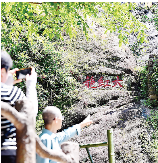
6月25日,游客在福建武夷山风景名胜区参观生长在武夷山九龙窠峭壁上的大红袍茶树母株。

过去10年,以轨道为载体,合福高铁完成了一次“山海无远,共赴青峦”的三向奔赴,勾勒出一幅区域共荣的盛世景象。这是流动中国的壮阔图景,更是乡村振兴的时代答卷。(张筱惜 张颖)