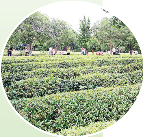
6月25日,游客在武夷星茶业有限公司茶叶种质资源圃参观。