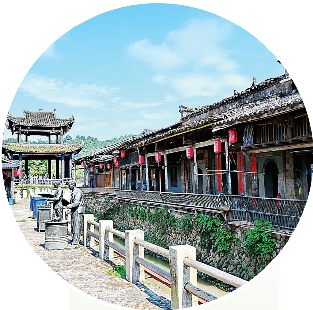
“中国历史文化名村”下梅村古街一角。

高铁带来的客流红利,成为当地产业升级的“催化剂”与城市经济的“加速器”。2024年,武夷山旅游总收入超300亿元,较2015年增长74%。