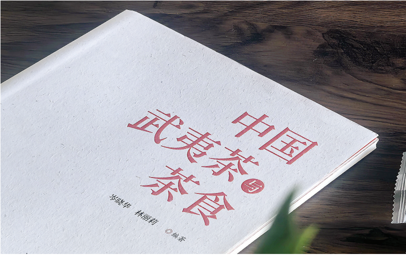
《中国武夷茶与茶食》

阅读《中国武夷茶与茶食》，分明感受到了作者对武夷山的热爱。二位作者，一位是资深爱茶人，可持续生活方式倡导者；一位是中医学博士，福建省中医药大学教授。她们将武夷山细致道来，从茶与茶食的历史源流到武夷