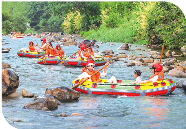
近日，游客乘坐橡皮艇在武夷山天仙谷亲水漂流。天仙谷漂流是我市新开发的亲水漂流项目，游客可体验从高处经玻璃滑道俯冲而下的刺激，在河道上畅享微风拂过的清凉，感受“船在水上漂，人在画中游”的惬意。

为推动基层文化建设，丰富群众精神文化生活，日前，以“武夷新歌声，百姓大舞台”为主题的武夷山市优质文化资源直达基层演出在列宁公园举行。本次活动由武夷山市委宣传部、新时代文明实践中心、崇安街道主办，木头吉他屋执行演出。 活动现场，架子鼓的节奏率先点燃现场热情。紧接着贰当家乐队、歌手们轮番登场，为观众带来了《借我》《人间》《至少还有你》等精彩曲目，台上台下汇成一片星光涌动的合唱海洋。 本次活动除了传统的才艺展示，还加入了开放麦的市民选唱环节。市民们纷纷勇敢登台，用歌声展示才艺、传递快乐。 这场活动不仅仅是一场音乐会，更是我市文化惠民工程的生动注脚。通过“政府引导+社会参与+文化赋能”的模式，将家门口的公园变身“资源中转站”，打通优质文化资源供给的“基层末梢”，打造新型文化体验场景，让文化真正走进基层。（来源：市委宣传部）