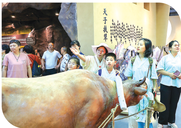
近日，袁隆平水稻科普馆在五夫镇开馆。作为华东地区首个以水稻科普为题材的专业展馆，占地1300平方米，设有九大板块，通过声光电、实物、互动装置及专业讲解，系统展示水稻历史与科技，并让游客沉浸式体验水稻生产与米食制作，是集科普、体验、培训于一体的综合性主题科普馆。

7月24日，武夷市公安局交警部门在全市范围掀起新一轮二轮车交通违法行为专项整治行动。行动聚焦非法加装遮阳伞、未按规定佩戴安全头盔等突出隐患，全面强化路面执法管控，遏制涉二轮车道路交通事故，筑牢夏季道路交通安全防线。 此次行动采用“定点+流动”双轨并行策略，在城区主干道、农贸市场周边等人流车流密集区域科学布控，形成严密的执法网络。在检查点，执勤交警对非法加装的遮阳伞依法进行现场拆除、收缴，及时消除车辆行驶中的风阻失衡及驾驶人视线遮挡等重大风险。针对未佩戴安全头盔的驾驶人，交警坚持处罚与教育结合原则，除依法处理外，更在现场开展面对面的警示教育，详细讲解头盔在事故中的关键防护作用，并督促其立即改正，确保“头”等安全落到实处。 整治行动有效提升了路面守法率，一批显见的交通安全隐患被当场清除。多位接受现场教育的市民表示深受触动：“交警讲得很清楚，装伞图一时凉快，出事就是大事。以后骑车，头盔一定戴牢。” “二轮车非法改装及不佩戴头盔是事故重要诱因，”市交警大队相关负责人表示，“此次专项整治将持续深化，保持高压严管态势，旨在最大限度消除风险，全力压降事故。同时呼吁广大市民自觉遵守交规，主动拆除遮阳装置，骑行佩戴合格头盔，共同营造安全、有序的道路交通环境。”（林李冰 彭剑伟）