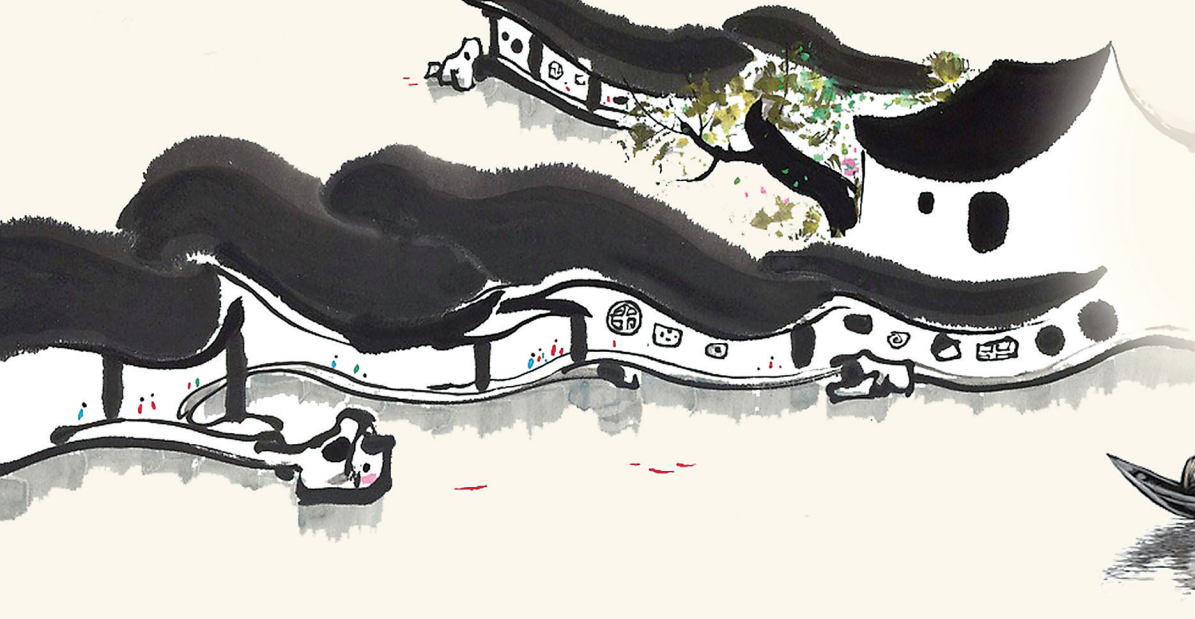
芳姿凝露(国画) 谢火英 作

柳永已作古千年，可柳词依旧经典，能做到“精妙语言、人文关怀、书写百姓”，对任何一个文艺工作者、任何一部作品来说，都可能成就经典，因为精妙语言舒心，人文关怀暖心，书写百姓润心，这也是柳词在自身艺术魅力之外，对当下文化工作的现实启示和精神价值所在。故曰“天下咏之”。