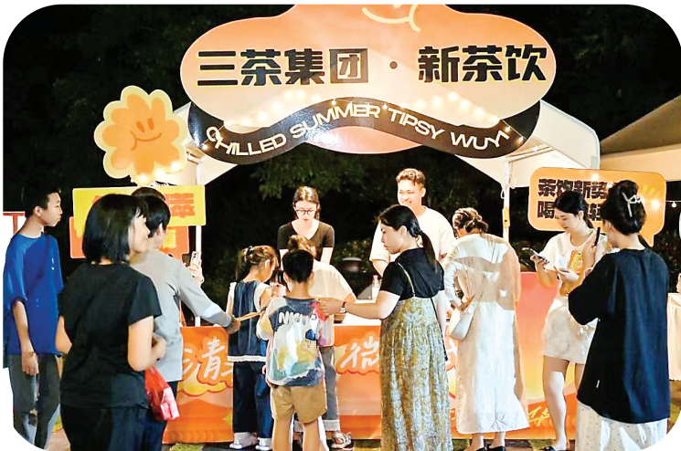
“清凉一夏·微醺武夷”系列活动现场,众多游客排队品尝新茶饮(三茶集团)