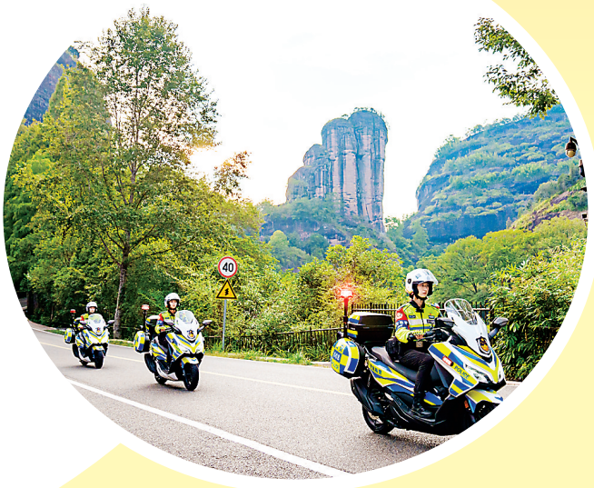
女子骑警队在景区等客流密集区域执勤,为武夷山旅游注入柔性执法力量,增添一道不一样的风“警”线。