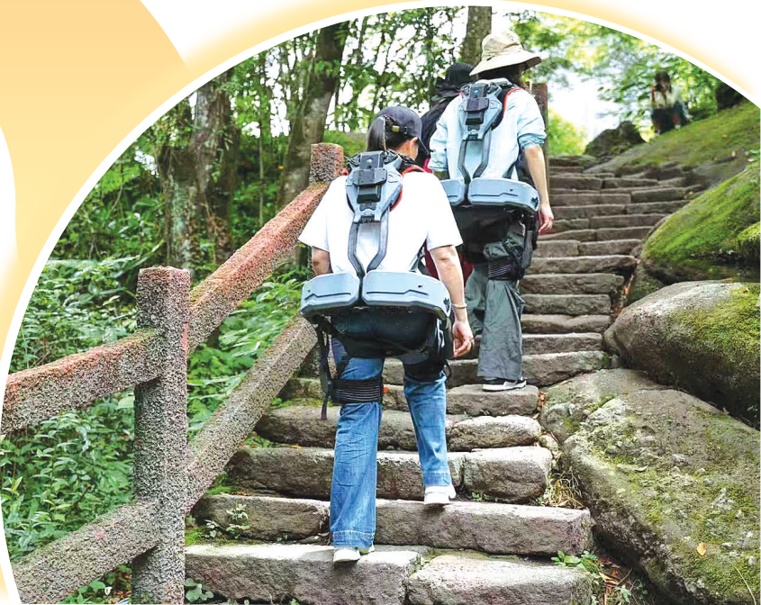
登山黑科技“外骨骼机器人”