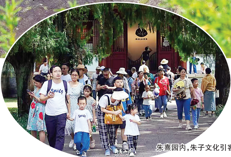
朱熹园内,朱子文化引客来。

措:武夷山文旅官方直播间累计开播15场,成为线上服务新窗口;九曲溪竹筏漂流运力提升至每日9000人,并免费提供2000台导游讲解器;全市公交免费运营,末班车延长至23:00,精准对接高铁班次开通免费接驳专线,累计运行4089趟;同时免费开放超过6000个停车位,有效缓解了自驾游“停车难”问题,实现假日旅游市场安全、有序、优质、文明。