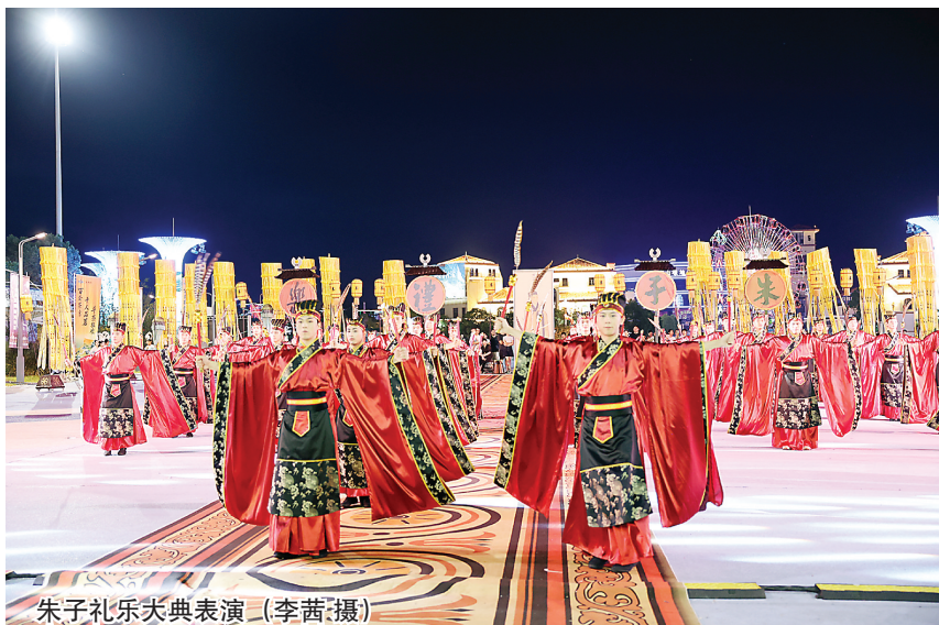
朱子礼乐大典表演

10月1日,随着夜幕降临,武夷山武夷广场灯火闪亮。两条金鳞闪闪的龙鱼从东西两侧游入视野,36名舞者排成六行六列,以传承千年的庄重舞步,诠释儒家礼制中的秩序与和谐,朱子礼乐大典表演开始。