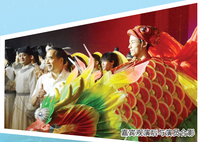
嘉宾观演后与演员合影

智者临水思深，仁者望山怀远。此刻回望，这座环形剧场渐渐隐没在武夷山水间，朱子走过的路，在众人脚下延伸——朱子探寻的理学月光，仍映照800年后的山川；朱子吟咏的九曲棹歌，依然回荡在奔流不息的九曲溪畔；朱子识得的姹紫嫣红，还在碧水丹山的清风中摇曳生姿。