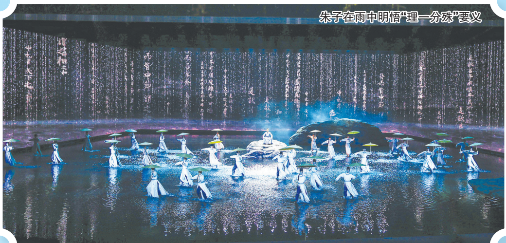
朱子在雨中明悟“理一分殊”要义