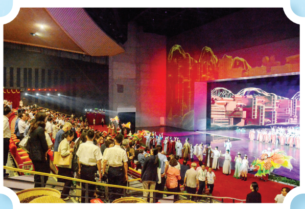
演出结束时演员走向观众

君且看，八百年的文脉，正顺着礼乐钟鼓声、九曲棹歌声、琅琅读书声，流淌在每一位观众的眉间心上。