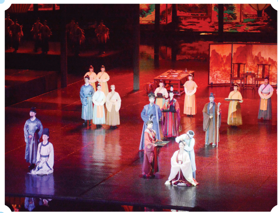
朱子家礼中的成人礼仪式