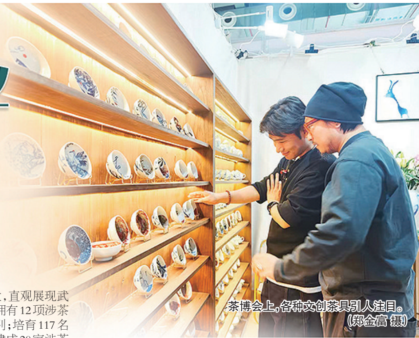
茶博会上,各种文创茶具引人注目。

在习近平总书记的重要指示精神指引下,近年来,新的茶文化力量、新的茶产业成果、新的茶科技理论在不断涌现。