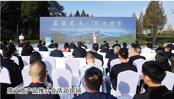
茶文旅产品推介会活动现场

11月17日,“茶旅武夷·星”火燎原”茶足径、世界红茶小镇、万里茶道起点小镇招商暨茶文旅产品推介会在武夷山市星村镇大坪洲举行。来自全国的行业专家、民宿、茶饮、餐饮品牌主理人、投资机构及创业青年等百余名嘉宾参会。