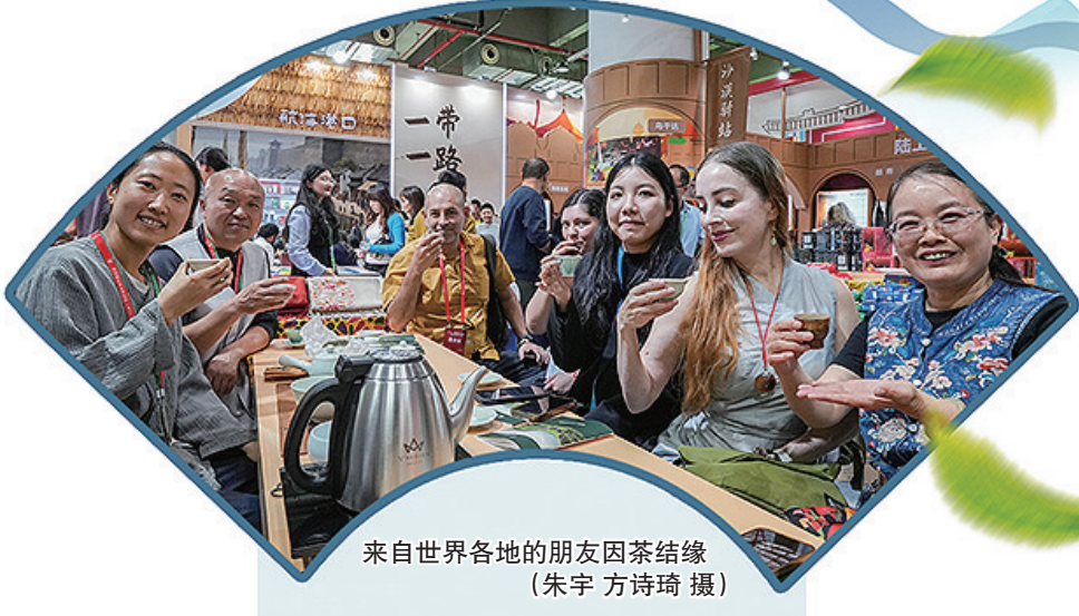
来自世界各地的朋友因茶结缘