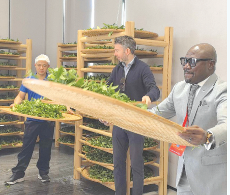
驻华使节们体验摇青

得热火朝天。 “我之前有了解一些关于茶文化的知识,但远不及今天学到的。”波黑驻华大使西尼沙·贝尔扬感叹,武夷山的茶具具有浓厚的中式韵味,文化底蕴带来的独特魅力与极高品质,都使武夷茶有实力在钟爱咖啡的波黑市场闯出一片天地。“如果想推广武夷茶文化,最好的办法就是让更多人来到武夷山,品尝这里的好茶。”西尼沙·贝尔扬笑着说,“茶博会说明一切。” 地处非洲中东部的“千山之国”布隆迪以产出优质高山茶叶闻名,本次参访,武夷山展现的制茶工艺、制茶机械与积极的营销策略令布隆迪驻华大使馆一等参赞曼达印象深刻:“如果这些工艺和机械能引入布隆迪,将对布隆迪茶叶走向国际市场有极大帮助。”他说,“一带一路”倡议使中布两国茶业工作者得以交流学习,也让茶产品能够走向全球,“我认为,要让更多人了解武夷茶文化,就需要在更多地方举行互动交流。” 走进海晟通仙生态茶园,驻华使节们亲手尝试采青,学习茶百戏等非遗技艺,欣赏茶艺表演……丰富多样的体验项目轮番登场,在沉浸式体验中,他们深刻感受到茶文旅的魅力与潜力。 “我相信大家都愿意通过这些茶文旅体验了解更多茶文化,将武夷山的茶带回家乡,这是一种很棒的文化交流方式。中国堪称‘茶叶之国’,我们期待从中国学习更多有关茶的知识,在合作最大化的过程中取得佳绩。”北马其顿驻华大使馆政治参赞博瑞杨说,“我认为,随着‘一带一路’倡议的不断推进,两国会越来越多机会进行茶文化交流与合作。” 深入武夷山水,感受迷人茶香背后的厚重文化与无限潜力,此次“外交官看武夷”活动既打开了武夷茶走向世界的新窗口,也为更多跨国互动交流奠定了基础。