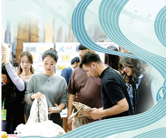
“一带一路”馆里,游客在选购来自阿富汗的羊毛围巾。