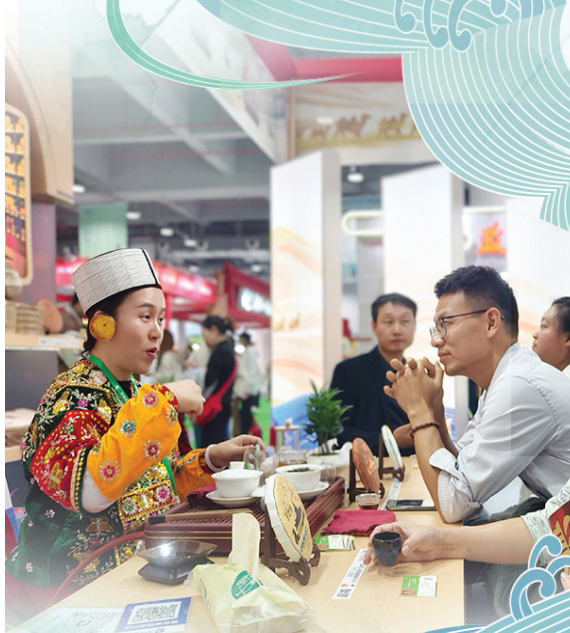
“一带一路”馆里,来自缅甸的茶商(左一)以茶会友。