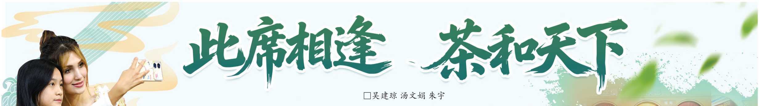
俄罗斯馆里,游客与俄罗斯姑娘合影。