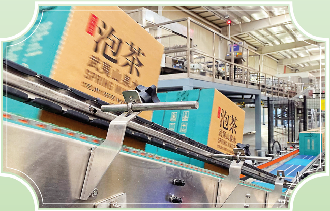
农夫山泉生产线