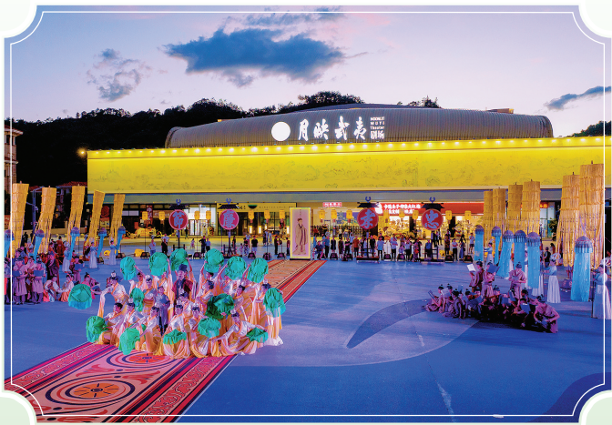
《月映武夷》暖场节目“朱子礼乐大典”