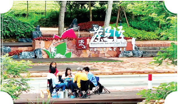
星村镇茶足径(资料图片)

成功防御2024年“6·9”极端暴雨洪涝灾害,取得“零死亡”重大胜利。 累计推进17个重点防洪治理项目,新建防洪堤210.81公里。 完成水土流失治理面积17.27万亩。 森林火灾受害率和有害生物成灾率均控制在任务值以下。