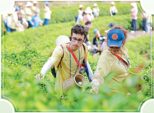
2025年汉语桥选手在武夷山体验茶文化