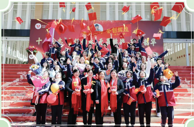
十四五时期,我市教育事业取得新突破