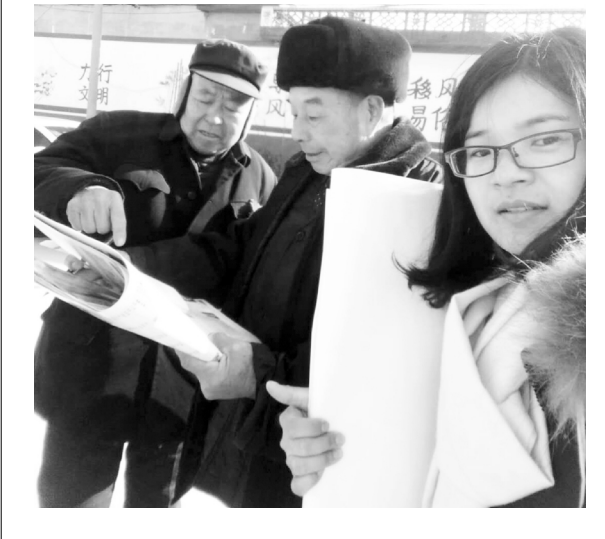
县志办工作人员在苏村镇陈家庄官庄村群众家中走访送年画

1月24日,县志办一行到苏村镇陈家庄官庄村群众家中走访送年画,进一步密切干群和群众的关系。 春节来临之际,该办将243份年画全部送到群众手中,并向他们表示深切的慰问。同时,该办联系群众的工作进一步向群众宣传惠民政策,让群众真切地感受到更多获得感,并认真倾听群众心声,收集群众的需求诉求,帮助他们解决生产生活中遇到的实际困难。