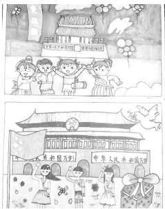
独树小学开展国庆系列主题活动

金秋送爽山河美,丹桂飘香秋辉煌。为了给新中国成立七十周年献礼,独树小学举行校园合唱比赛和书画展。本次活动,老师们和同学们都投入了极大的热情,同学们把自己对党和祖国的热爱、对远大理想的追求都融入歌声和画作中,展现校园文化艺术风采,培养团结合作精神,提升了学生的综合素质,促进学校艺术教育活动的普及和提高。