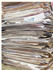
全国各地顾客的反馈信