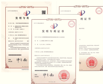
3个优质菌株的发明专利证书

变通益生菌有3个国家专利菌：植物乳杆菌LP45、两歧双歧杆菌TMC3115、嗜酸乳杆菌，安全可靠，而且有专利的菌株无论是作用、肠道耐受性、活性等方面都更可靠，在经过胃肠液的消化后，仍可保持足量活菌数到达肠道定植，发挥有效作用。