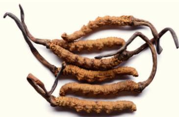
蝙蝠蛾拟青霉菌体源于冬虫夏草, 是分离自冬虫夏草的菌株。