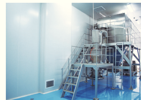
超微粉碎设备 专利类别:实用新型专利 专利号:ZL 2014 2 0598882.1 专利名称:共用气源系统与粉尘收集伺服系统的组合式超微粉碎机

中老年的吸收一直是个难题。为了改善这一情况,臻通集特别选择2种工艺。三七进行了超微粉碎,其余的6种都采用提取物的方式,标志性成分得到充分释放。每粒胶囊都是精华,每粒臻通集吃进去都不浪费。