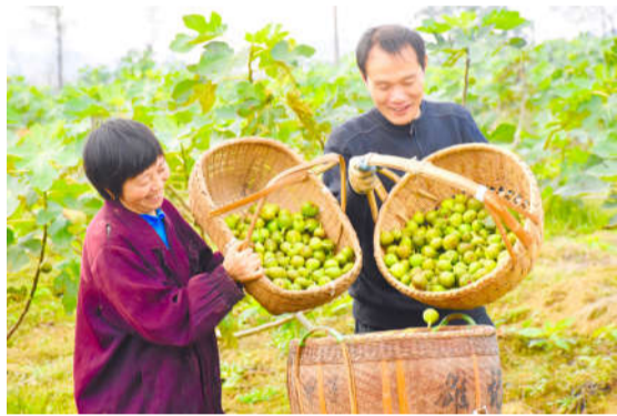
千山农林中药材种植基地无花果丰收。

回顾 2018, 少阳乡不忘初心, 牢记使命, 奋力拼搏, 全乡经济社会平稳健康发展。