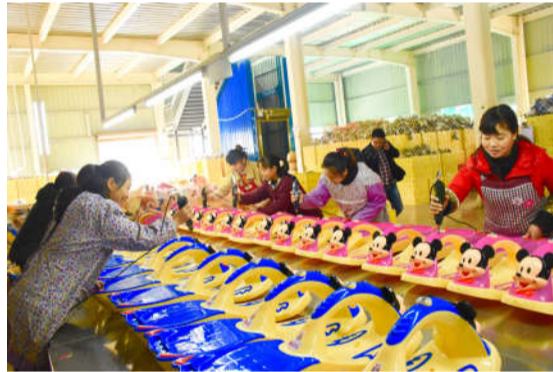
华飞模塑厂赶制玩具车。

800 余万元。完成全民参保、参保计划, 城乡居民基本医疗保险参保人数 25309 人, 累计发放民政优抚补助 71.415 万元, 农村低保补助资金 357.4609 万元, 80 周岁高龄补贴 38.408 万元, 大病医疗救助资金 29.1097 万元。