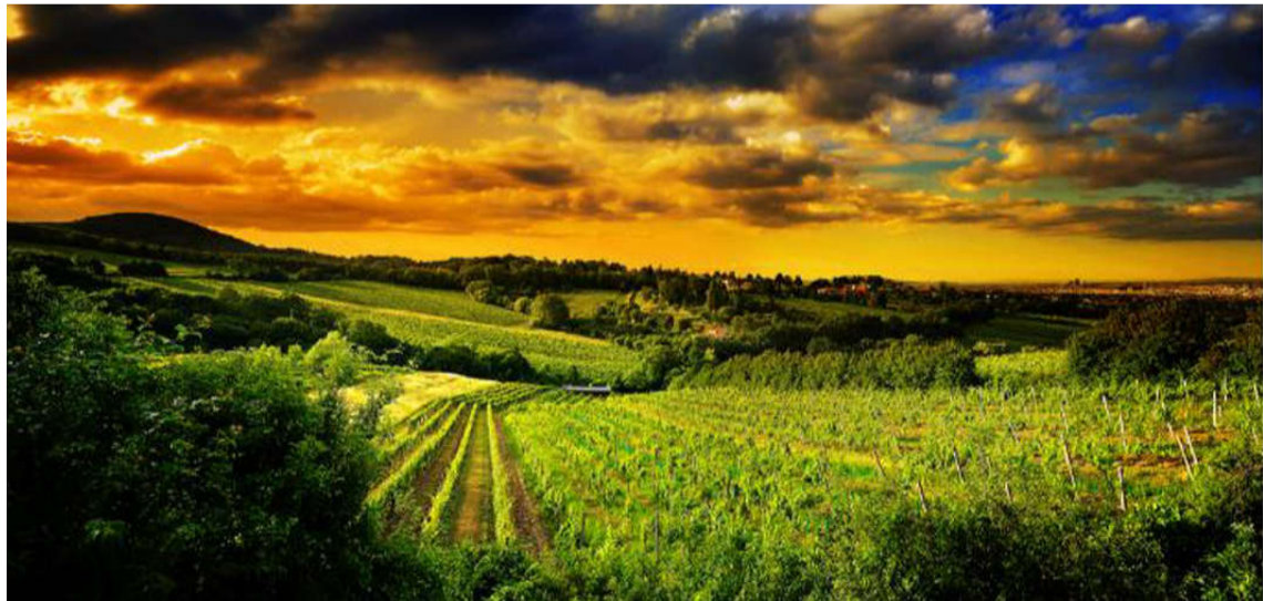
秀美乡村景色宜人。

志士惜日短, 勇者常为新。展望 2019, 少阳拥抱新时代, 踏上新征程, 更须撸起袖子加油干。2019 年, 少阳乡将继续奋进尤为、砥砺前行, 团结带领全乡人民, 凝心聚力、真抓实干, 不忘初心、牢记使命, 拥抱新时代, 展现新作为, 为决胜全面小康继续奋斗!