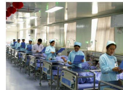
强化优质护理,提升服务质量。

新的一年孕育新的希望,新的征程谱写新的辉煌。2019 年,是新一轮医改启动实施 10 周年,也是贯彻新发展理念,落实“十三五”卫生与健康规划,推动高质量发展的关键一年!区人民医院全院上下将紧紧围绕区委政府的战略部署,将继续把保障人民群众身心健康的责任扛在肩头,进一步深化医院各项改革,为老百姓提供诊疗更安全、就诊更便利,获得感更多的优质医疗服务,为广丰百万人民群众身体健康做出新的更大贡献!