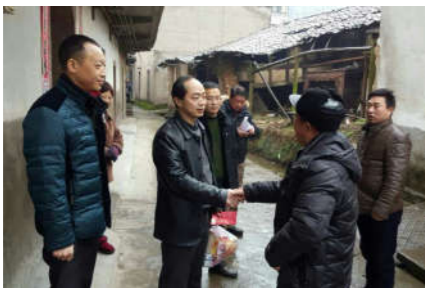
走访入户传真情,扶贫慰问暖人心。

2018 年,在区委、区政府的坚强领导下和社会各界的大力支持下,广丰区人民医院以全面开展第三轮二甲评审为抓手,秉承“厚德仁医、严谨求实”院训,把满足人民群众对医疗卫生服务的需求作为发展的出发点,坚持以病人为中心的服务理念,狠抓医疗质量、改善就医环境,优化医疗服务,医院各项工作取得了全面的发展。2018 年,区人民医院接诊门诊病人人数达 352266 人次;住院病人 35976 人次,床位使用率为 100%;开展手术共 4956 人次;总业务收入达到 2.74 亿元,比去年同期增长 7.4%。