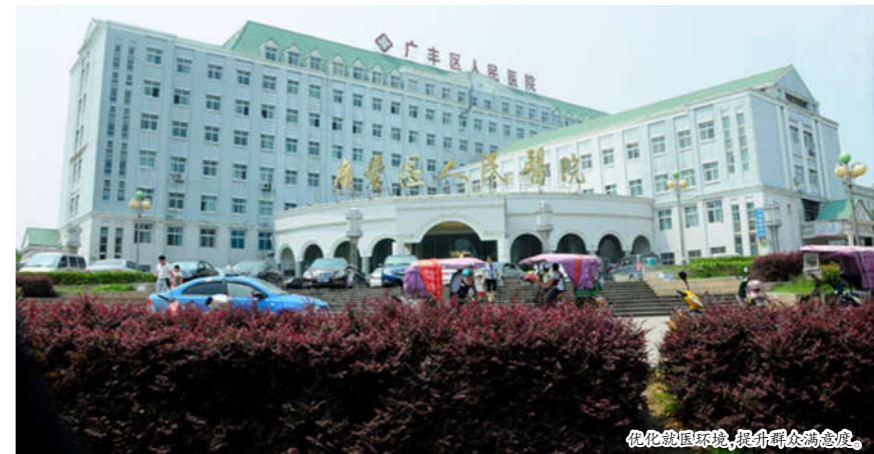
优化就医环境,提升群众满意度。

务模式,组织 78 名党员干部到驻点沙田镇、五都镇、少阳乡等 3 个乡镇的 7 个帮扶村共 88 户贫困户家庭进行走访慰问、健康体检、赠送药品等活动,积极组织党员干部进行扶贫捐款活动。强化主体责任,开展“一把手”对班子成员、分管领导对分管科室负责人集体廉政谈话;创新“看廉片、听廉课、观廉展、考廉试”四位一体活动模式,对全院党员干部进行《准则》《条例》知识测试,先后组织 200 多名科主任、党员干部、重点岗位职工及 400 多名临床医务人员集中观看反腐倡廉警示片 50 多次,到方志敏博物馆、毛泽东敬仰堂接受革命传统廉政教育。2018 年,该院全年共进行了检查 6 次,约谈支部主要负责人 3 次,发现并整改实际问题 12 条。全年共组织党员志愿者深入社区、村居开展健康义诊 8 次,诊疗人次 500 人次,做到困难群众全覆盖;并拨出专项扶贫援建资金 29145 元,用于少阳乡泉岭村卫生所建设,不断提高帮扶