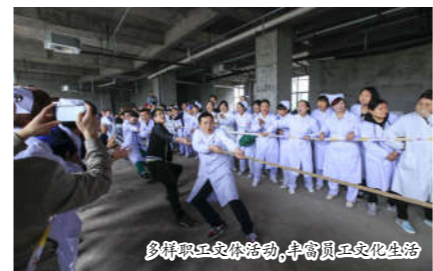
多样职工文体活动,丰富员工文化生活。

按月持续开展“6+X”主题党日,党委班子成员带头讲授廉政专题党课。定期开展“不忘初心、崇德尚德”系列专题讲座,在全院开展星级支部创建活动,制定了《广丰区人民医院党建提升月活动方案》,健全了支部交叉检查机制,采取听、看、查、访的方法对各支部进行检查,定期进行通报、约谈检讨;采取“健康体检+结对帮扶+政策支援”三位一体服