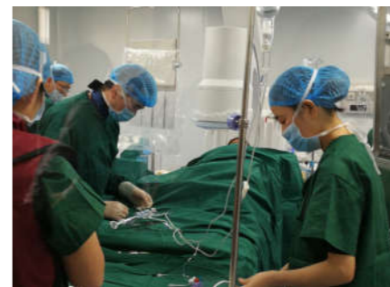
远程医疗会诊,让患者在当地享受优质诊疗。

做好公共卫生工作,坚持预防为主,关口前移。扎实做好重大疾病防控和公共卫生工作,坚持预防为主,关口前移,