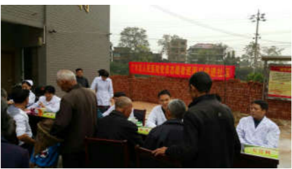
党员进社区,义诊送健康。

严格医疗质量持续性改进制度。医务科、护理部、院感科等职能科室组织和督促定期开展医疗质量检查活动,对病历、处方的书写,抗菌药物的使用以及医院感染控制执行情况进行认真检查,综合分析,并严格按照医院管理制度进行