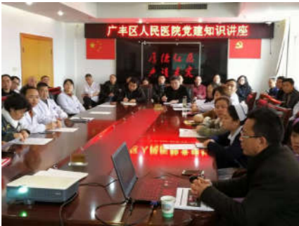
夯实党建基础,上好专题党课。