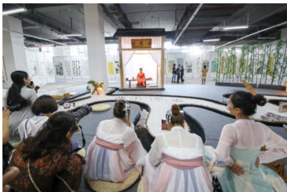
品味江西·曲水流觞茶道艺术交流会现场。