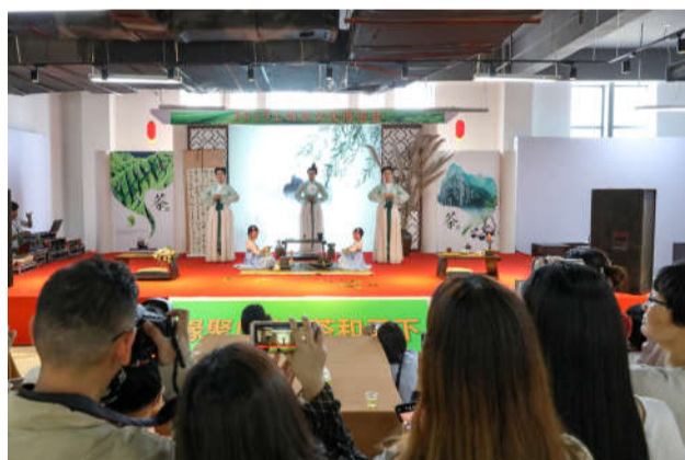
茶文化茶艺邀请赛活动现场。