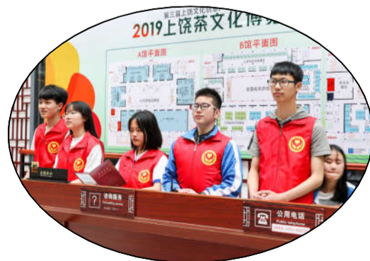
志愿者微笑服务茶博会。