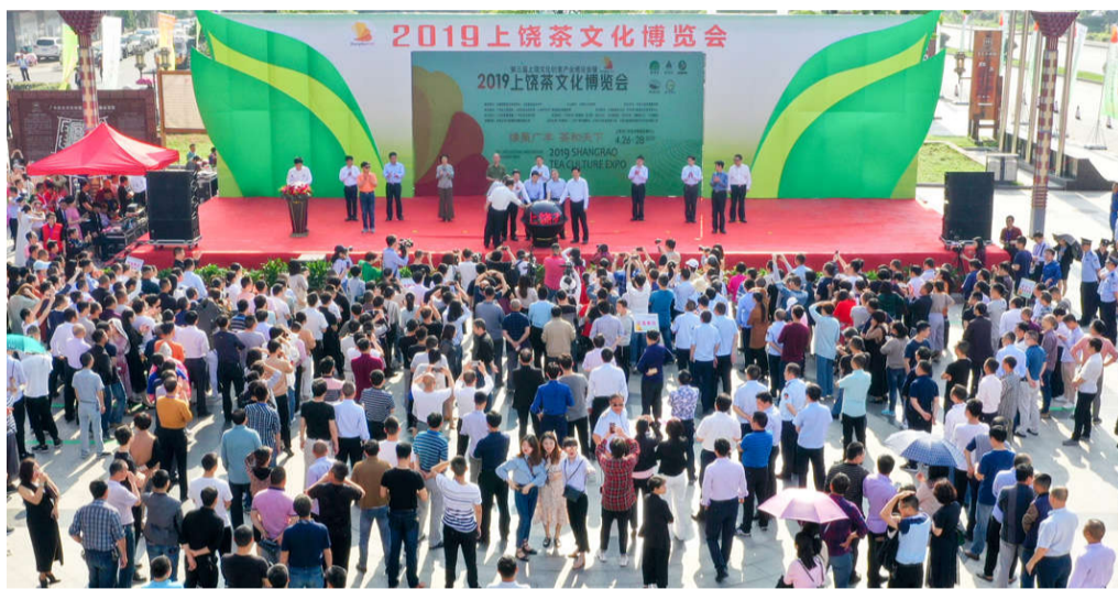
2019 上饶茶博会启动仪式。

茶香为媒迎嘉宾, 节会为桥聚商客。4月28日, 为期三天的2019“缘聚广丰, 茶和天下”上饶茶博会在广丰木雕城圆满落幕。博览会期间, 先后举办了首届赣浙闽皖茶文化茶艺邀请赛、品味江西·曲水流觞茶道艺术交流会、最美江西·魅力上饶沙画表演、“读一本茶书, 品千年文化”、“茶与生活”文化分享、茶产业推介等展茶、品茶、论茶、赏茶系列文化活动, 是一次以茶产品为媒介、茶文化为内核的盛会。“茶让生活更美好”的茶文化活动贯穿全场, 余音绕梁, 经久不息。博览会期间, 本报记者走进广丰木雕城, 用镜头记录2019上饶茶博会盛况。