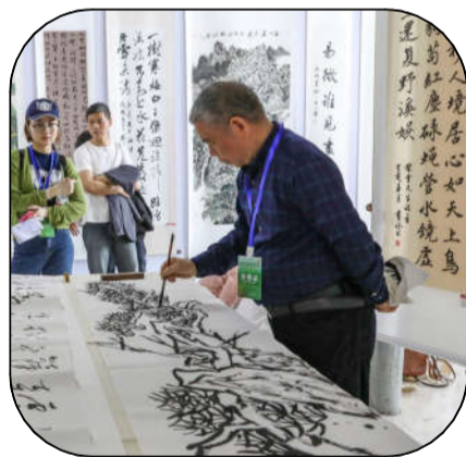
名家现场书画。