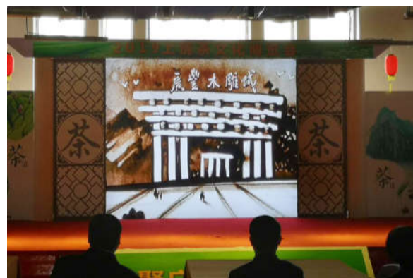
魅力上饶沙画艺术表演。