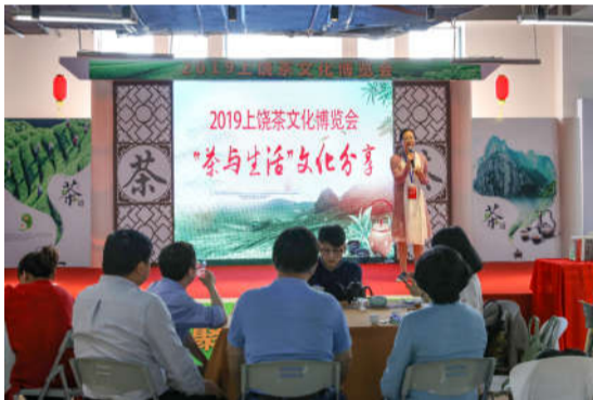
“茶与生活”文化分享。