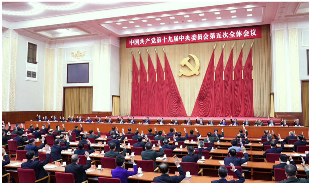
中国共产党第十九届中央委员会第五次全体会议，于2020年10月26日至29日在北京举行。中央政治局主持会议。