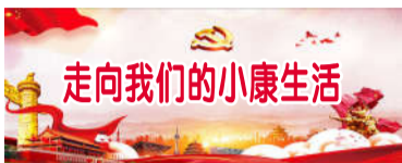
走向我们的小康生活

本报讯 姚科、魏望报道:绿水青山就是金山银山。近年来,广丰区桐畈镇继续流转土地,大力实施“一村一品”“一村一业”的产业发展模式,多举措、多渠道推进村级集体经济发展,在村集体经济产业支撑、品牌培育上下功夫,形成了特色鲜明的农村经济发展格局,带动当地百姓增收致富,壮大了村级集体经济,走出了一条以生态优先、绿色发展为导向的振兴发展之路。